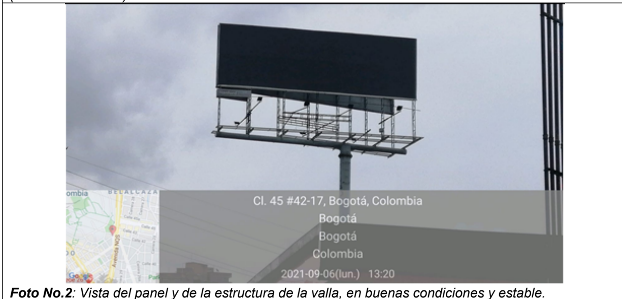
Foto No.2: Vista del panel y de la estructura de la valla, en buenas condiciones y estable.