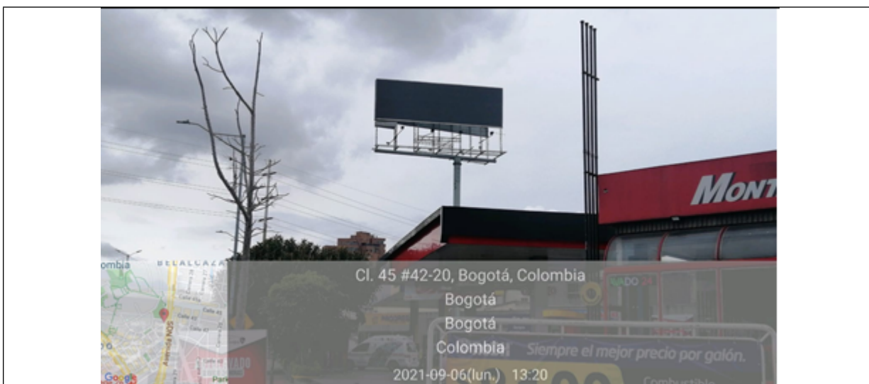
Foto No.1: Vista panorámica del predio y de la valla ubicada en la Av. Carrera 30 No. 41-25 (dirección catastral) orientación Norte-Sur